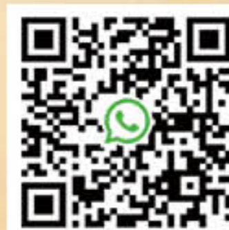
地域訊息發放社群