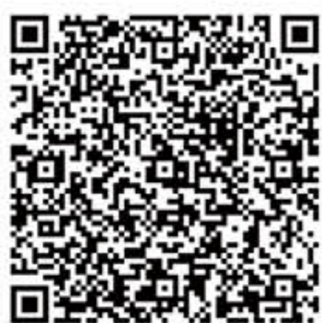
性罪行定罪紀錄 查核豁免安排 (政策通告第02/2026號)