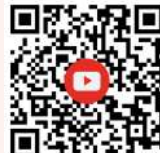
地域 YouTube 頻道