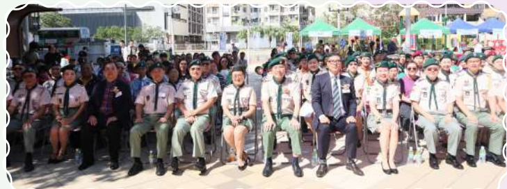
深水埗西區金紫荊獎章獲獎成員