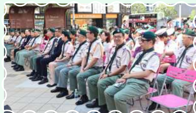
總領袖獎章獲獎成員