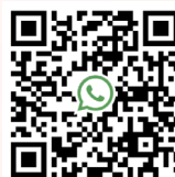
地域訊息發放社群