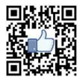
地域 Facebook 專頁