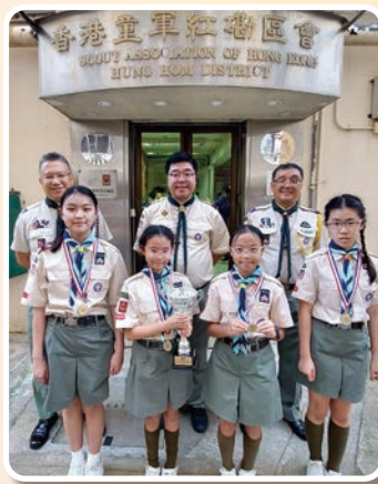
亞軍—九龍第 80 旅