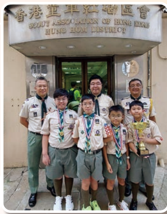
冠軍—九龍第 42 旅 B 隊

比賽結束後，我們回到區總部進行頒獎典禮。整個比賽得以順利進行，實在有賴區內各童軍兄弟姊妹，特別是一班陪著幼童軍們「跑足全程」的服務童軍，在此謹致衷心謝意，並再次祝賀各個獲獎的童軍旅。