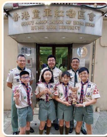
季軍—九龍第 1272 旅 A 隊