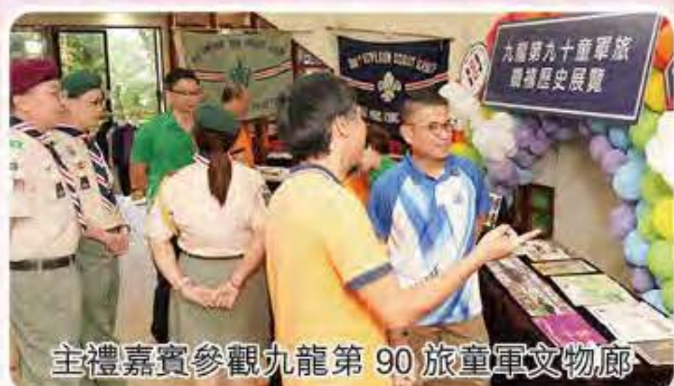
主禮嘉賓參觀九龍第 90 旅童軍文物廊

主禮嘉賓隨後參觀及了解本旅不同年齡成員參與各支部集會的情況，小童軍及幼童軍一同參與西九龍總區防止罪案辦公室及一班「動物守護・社區大使計劃」義工，講解愛護動物和防止殘酷對待動物的工作坊，加強成員善待動物和尊重生命的意識。