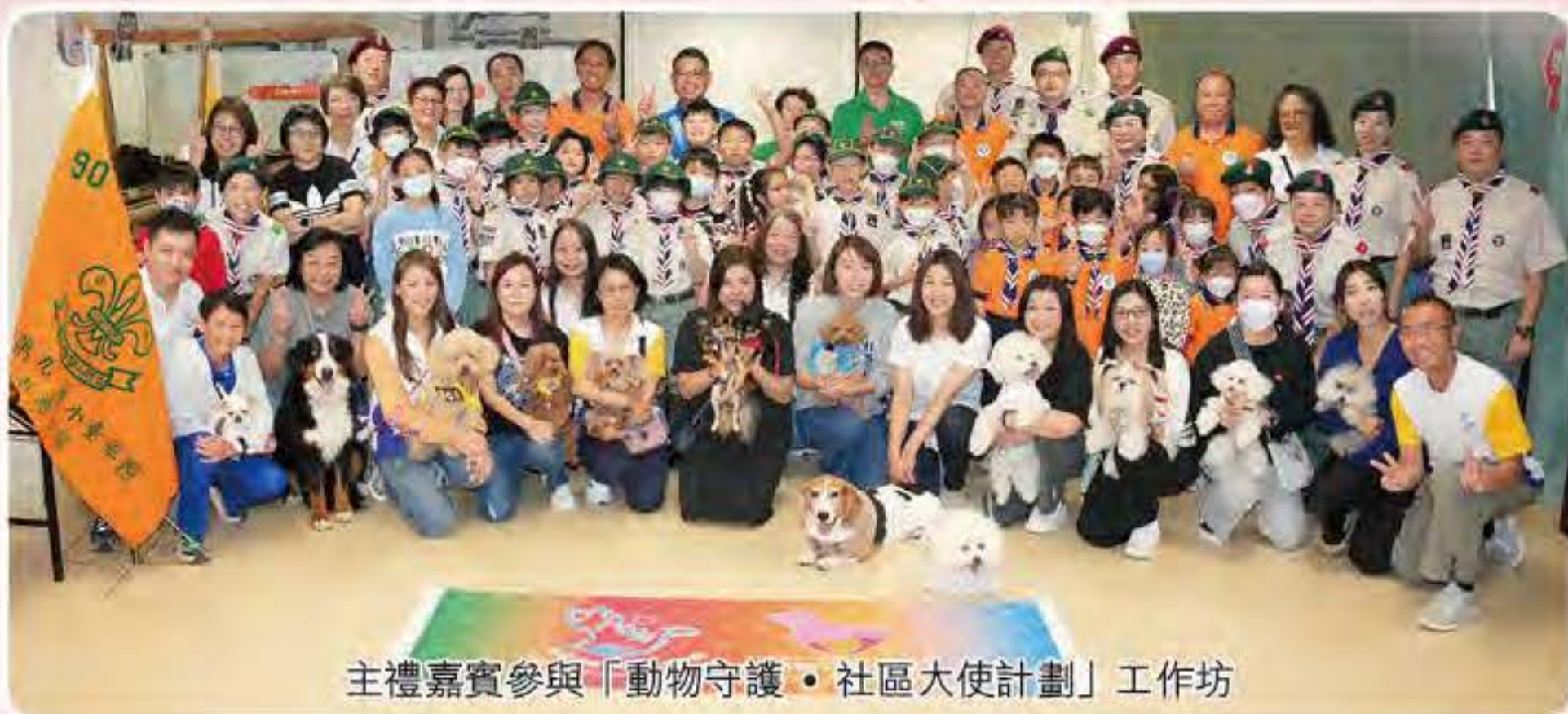
主禮嘉賓參與「動物守護・社區大使計劃」工作坊